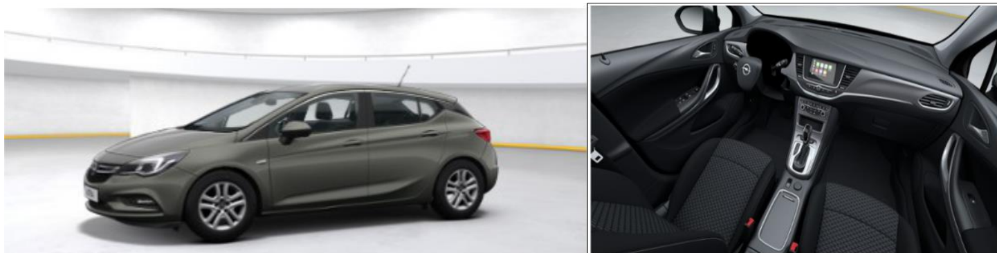
Astra Enjoy 5-drzwiowy 1.4 Turbo 110 kW / 150 KM Start/Stop Autmatyczna skrzynia (AT6)

Dostępne kolory metalik: CZARNY, SREBRNY, SZARY,